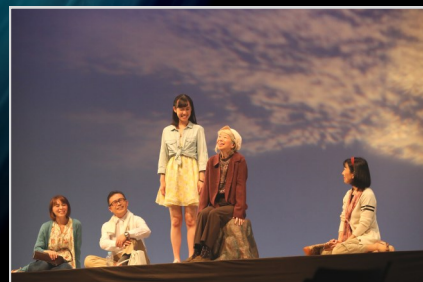
2018.6.3 第6回公演「人生の贈り物」より 作: 小河美弘 / 脚本・演出: 犬石隆 (劇団ONEオリジナル作品)