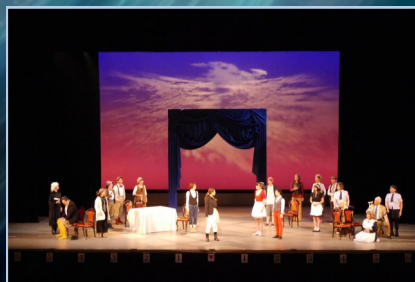
2017.6.4 第5回公演「十二夜」より 作: W. シェイクスピア / 演出: 犬石隆

劇団ONEは、文化推進プロジェクトの一環として、演劇活動を通じ、団員の親睦と世代間の交流を図り、戸田市における文化芸術の振興と発展に寄与することを目的に戸田市文化会館が設立した劇団です。